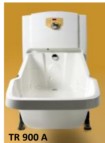
TR 900 A