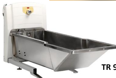
TR 900 SS