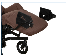
odnímatelné sklopné podnožky

odchyly v rozměrech a hmotnosti +1,5 cm / 1,5 kg