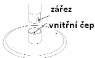
obr. č. 3