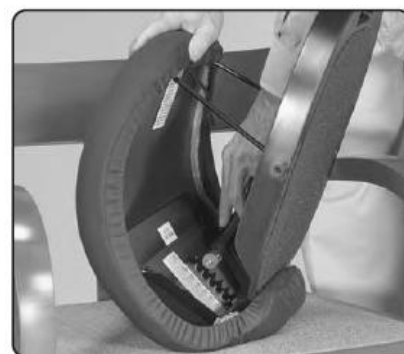
Vyberte vhodnou pozici pro uživatele a píst umístěte mezi zářžky.