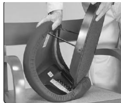
Stlaďte ohybem čalouněného sedáku.