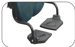
výškově nastavitelné a odnímatelné stupačky