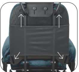
4 otvory pro snadné a bezpečné použití stabilizačního pásu