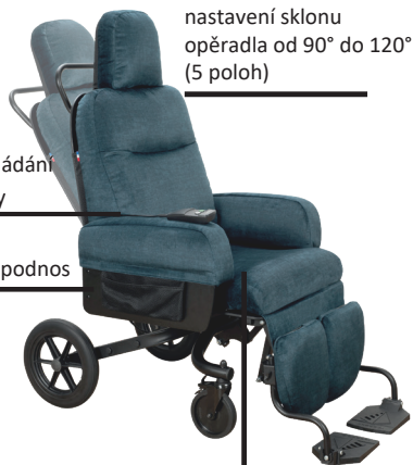
nastavení sklonu opěradla od 90° do 120° (5 poloh)