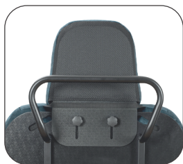
výškově nastavitelná opěrka hlavy