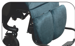
nastavitelné a odnímatelné opěrky lýtek